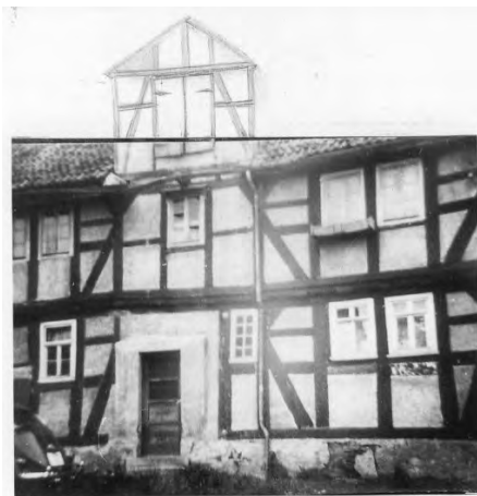
Haus in der Arolser Straße 10